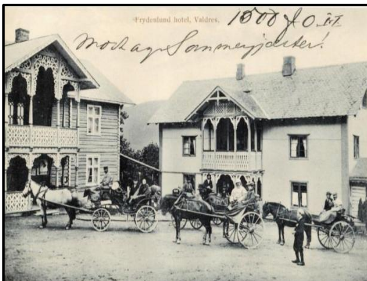
Frydenlund skysstasjon rundt 1900.

Den kommunale planstrategien legger føringer for hva slags planer som skal revideres eller utarbeides i innværende kommunestyreperiode. I gjeldende planstrategi står det at fag- og temaplaner, handlingsplaner skal revideres fortløpende etter behov, hvor gjeldende kulturminneplan er listet opp blant de aktuelle. Det legges nå opp til å endre status på kulturmiljøplan til å bli en «kommunedelplan».