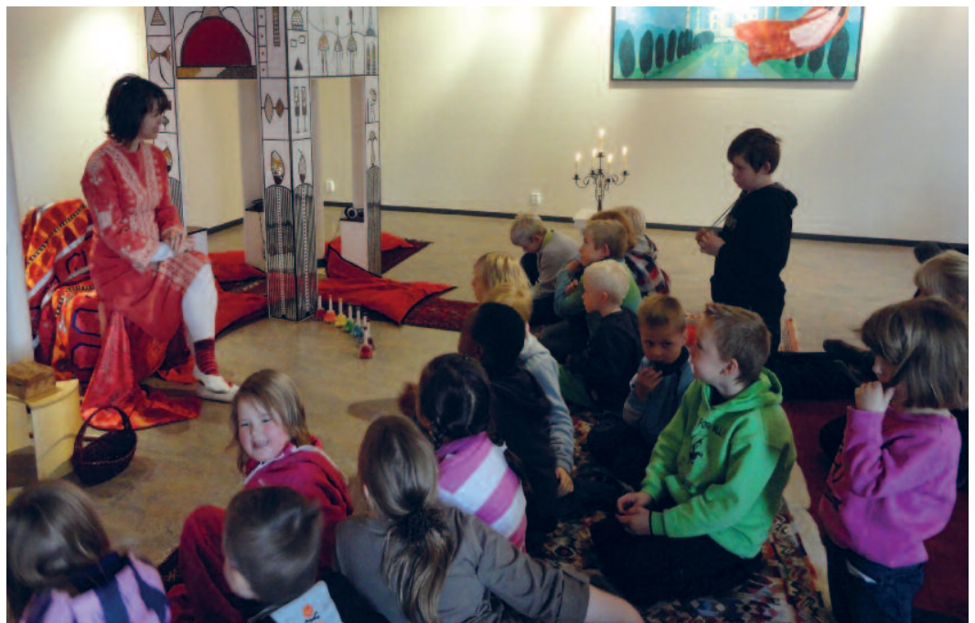
"Arabisk veke" Vang folkebibliotek.