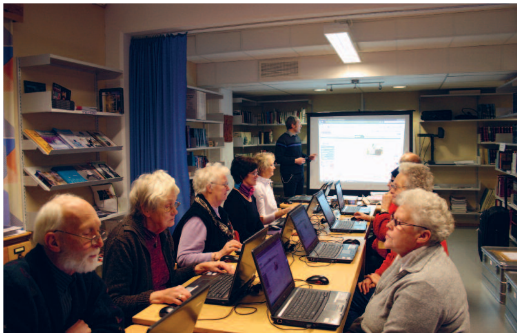
“Seniorsurf” Sør-Aurdal folkebibliotek.