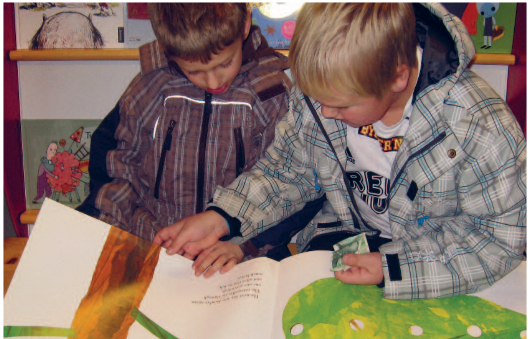
“Gutta leser” Sør-Aurdal folkebibliotek.