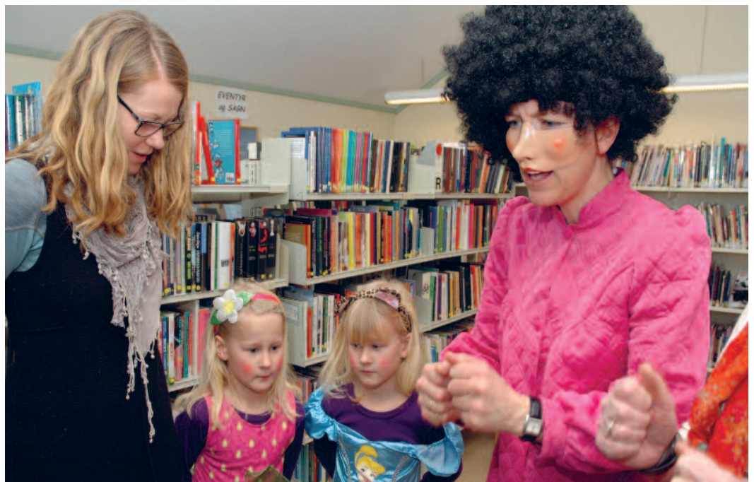
"Julebukkmoro" Vestre Slidre folkebibliotek.