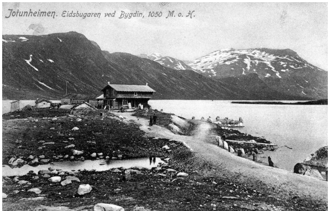
"Eidsbugarden 1908"