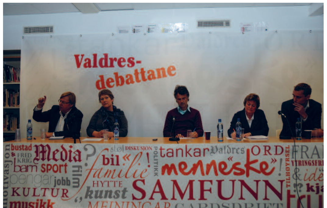
"Valdres-debattane" Nord-Aurdal folkebibliotek.