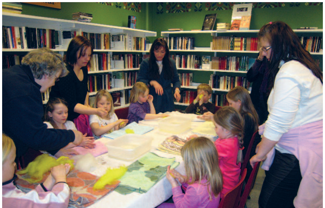
“Påskeverkstad”. Øystre Slidre folkebibliotek.