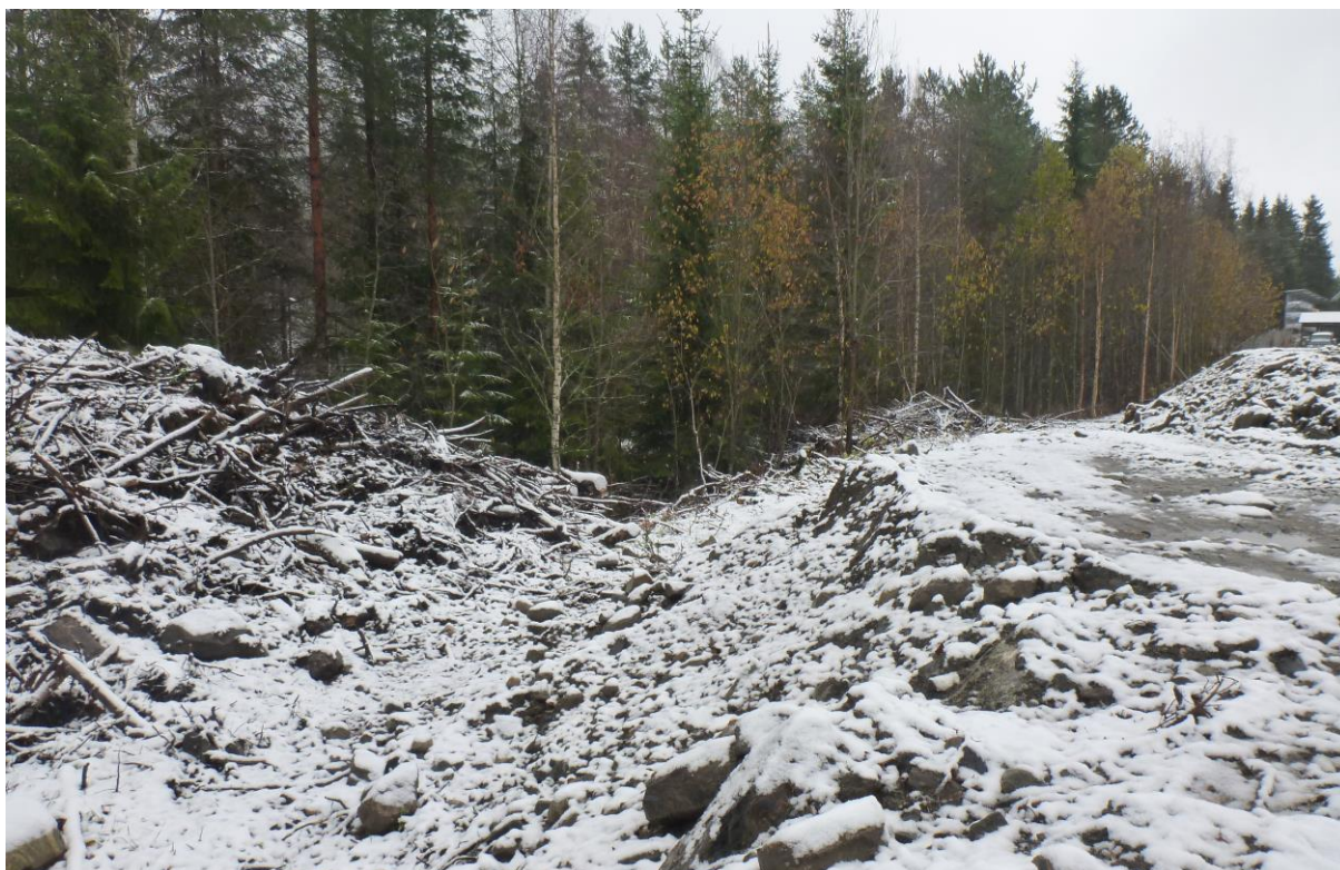
Bilde 2: Oversiktsbilde av skråningen fylt med hogstavfall på østsiden av Felleskjøpet. Sett mot sørøst.