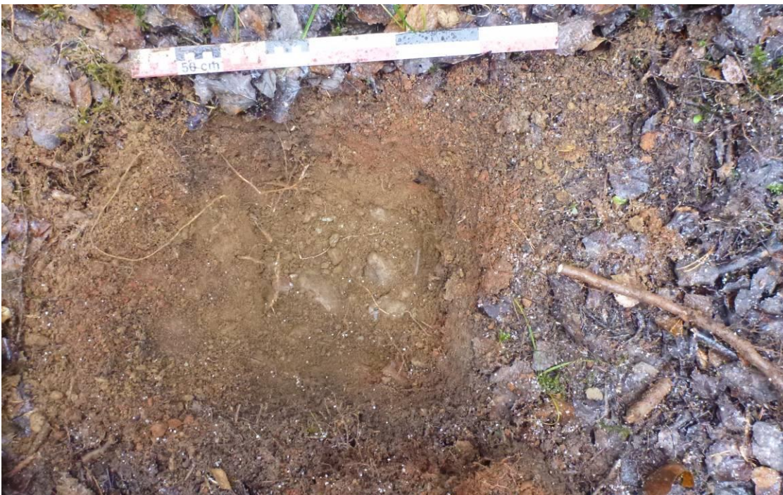
Bilde 4: Prøvestikk nr.5 i plan, sett mot vest.