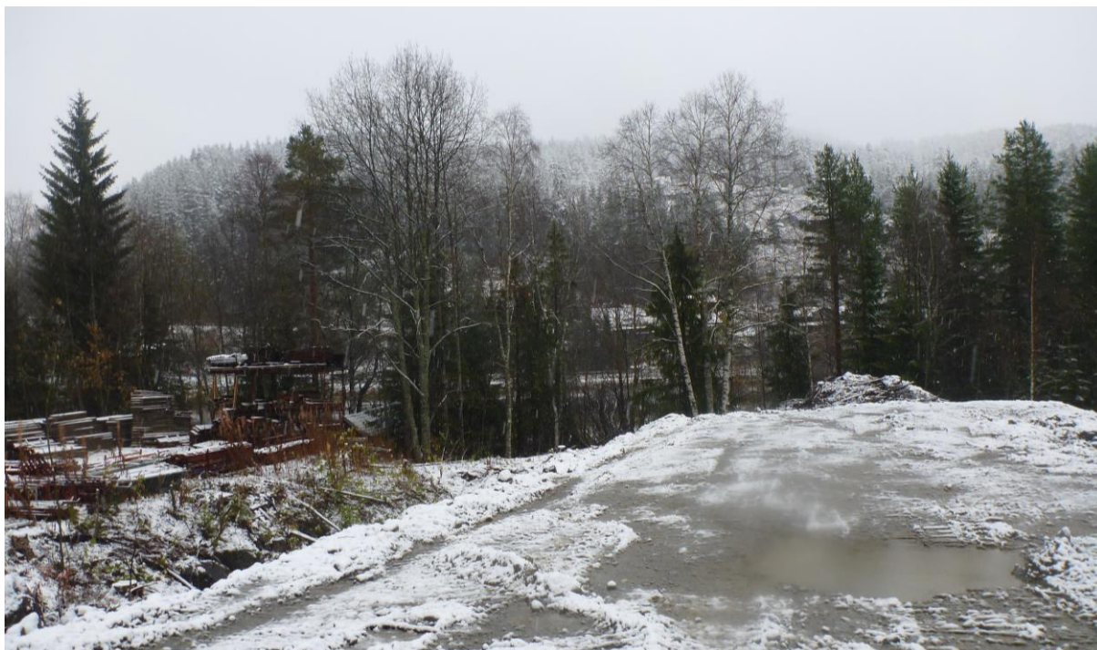
Bilde 1: Oversiktsbilde av planområdet, ved utbyggingsson på nordsiden av p-plass for Felleskjøpet. Sett mot øst-nordøst.

horn/bein, skjørbrent stein, kull, kulturlag osv. Massen tørrsolles eller vannsolles i bøttelag for å påvise eventuelle funn.