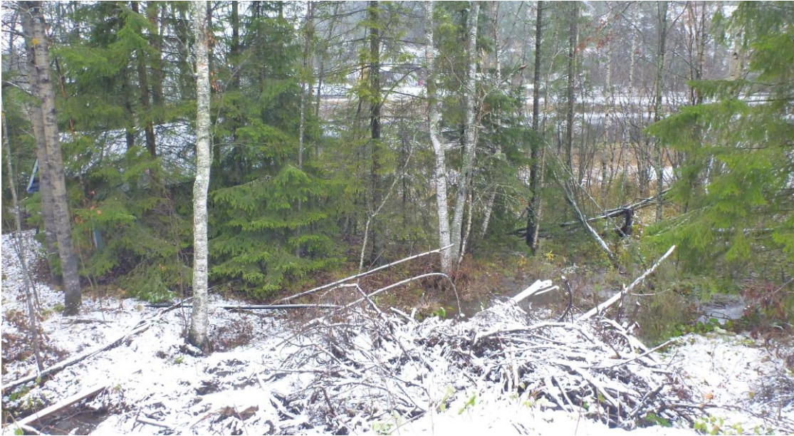
Bilde 3: Planområdet i øst som er tilsynelatende urørt av moderne bebyggelser. Sett mot nordøst.

Den arkeologiske registreringen ble utført den 24.10.2017 av Anna McLoughlin. Det ble prøvestukket på noen av utvalgte steder med potensial for funn fra steinalder. Dagen for registreringen begynte det å snø mye, og på grunn av dette og at deler av området bestod av myr og det ble lagt store hauger med hogstavfall langs kanten av utbyggsområde (Felleskjøpet) – ble det ikke mulig å nå frem til et av områdene med potensial for funn fra steinalder i øst (ved osen). Det ble gravd totalt fem prøvestikk på et område nærmere felleskjøpet. Alle prøvestikk målte ca. 40 x 40 cm, og dybde varierte mellom 0,3 - 0,6 m. Alle prøvestikk var negative, og undergrunnen bestod av rødbrun sand/silt med lite stein. Alle prøvestikk ble vannsoldet.