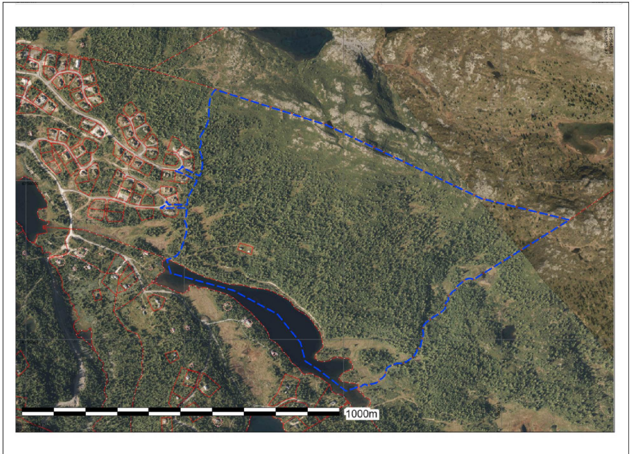
Flyfoto – Storstøllie Øst – planavgrensning vist med blå stiplet linje